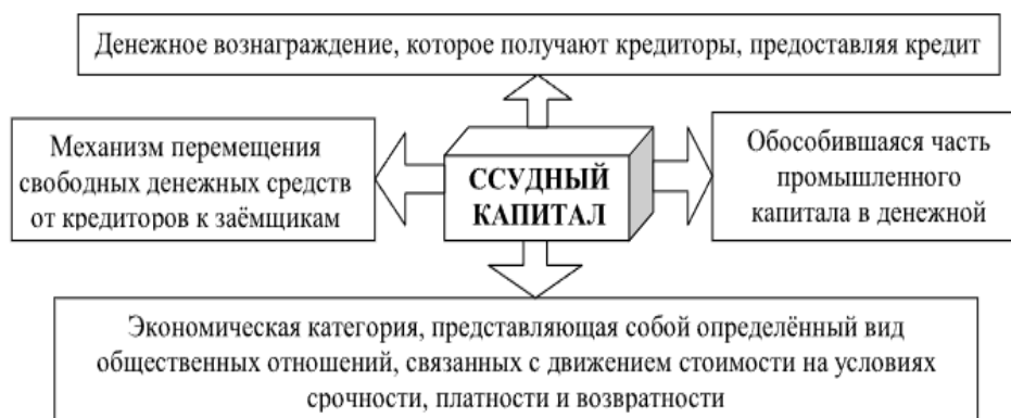
Рисунок 2.1 – Определения

Требуется выявить определение, характеризующее ссудный капитал.