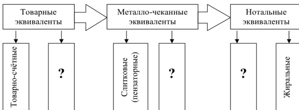
Рисунок 1.1 - Эволюция формирования всеобщего эквивалента

9. Эволюция формирования всеобщего эквивалента может быть представлена на рисунке 1.1: